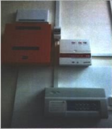
Фото № 17 - Акустическая система оповещения о пожаре