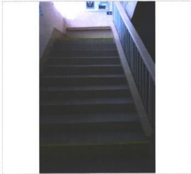
Фото № 6 – Пути движения внутри здания)