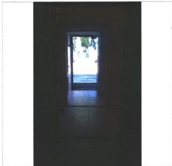
Фото № 5 – Пути движения внутри здания