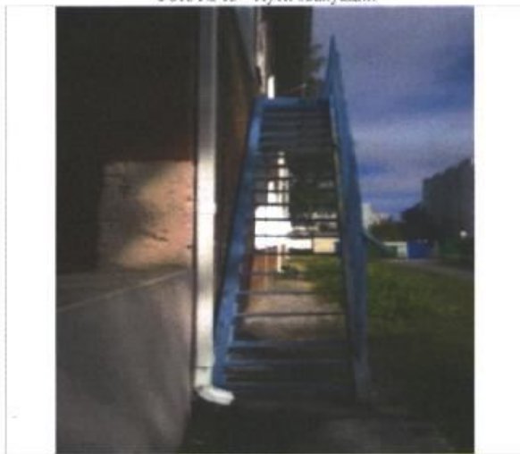
Фото № 15 - Пути эвакуации