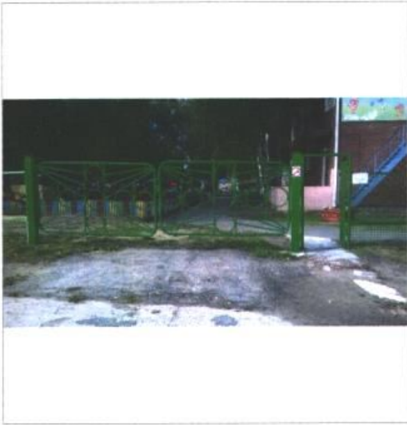
Фото № 1 – Прилегающая территория