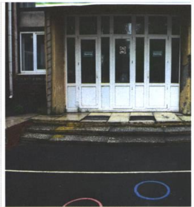
Фото № 14 - Пути эвакуации