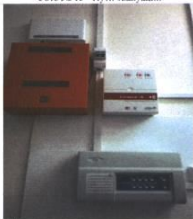
Фото № 17 - Акустическая система оповещения о пожаре