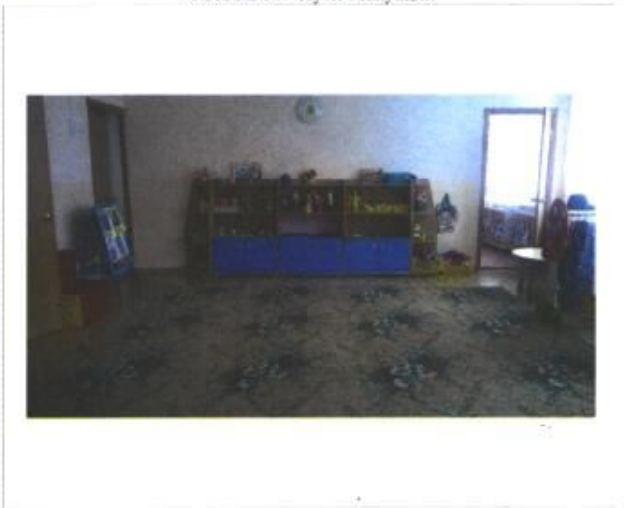
Фото № 16 - Группа