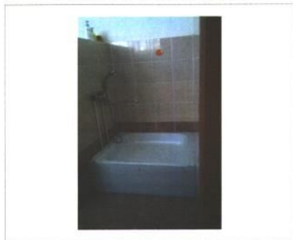
Фото № 9 – Санитарно-гигиенические помещения