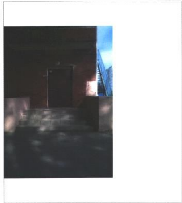
Фото № 4 – Вход в группу