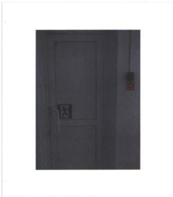
Фото № 13 - Пути эвакуации