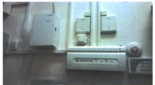
Фото № 18 - Акустическая система оповещения о пожаре