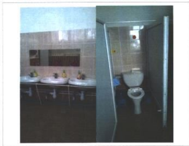
Фото № 8 – Санитарно-гигиенические помещения