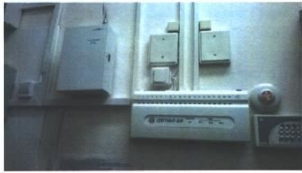
Фото № 18 - Акустическая система оповещения о пожаре