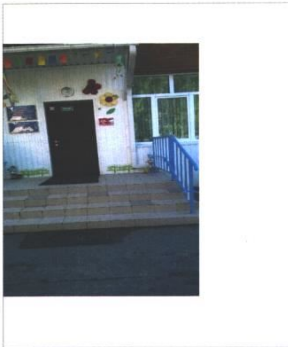
Фото № 3 – Вход в здание