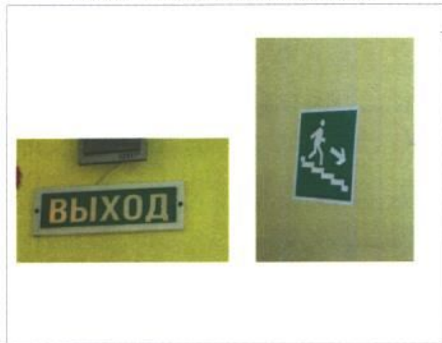
Фото № 10 - Система информации на объекте