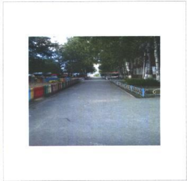
Фото № 2 – Прилегающая территория